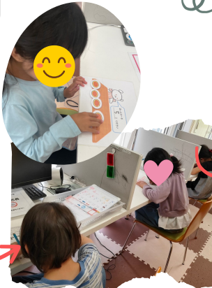
みんな集中してます！ 頑張ってるね♡